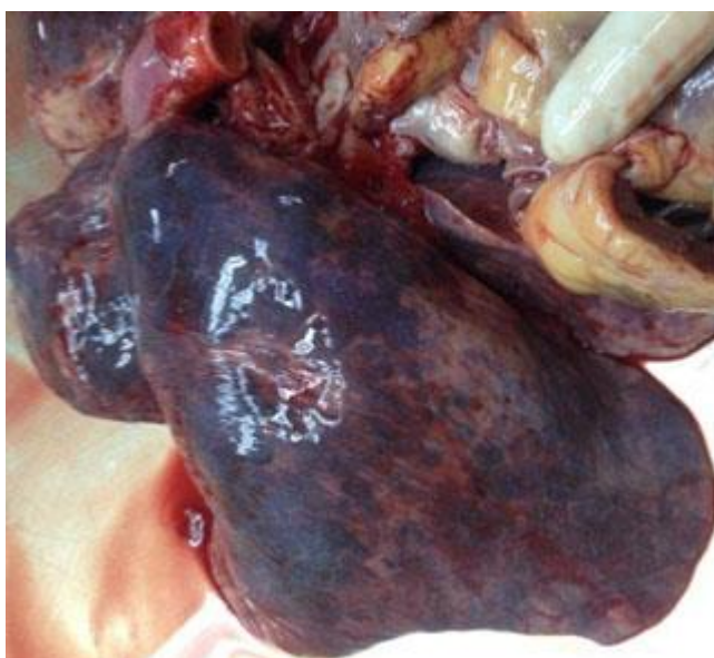
Fig. 2 - Hígado con abscesos y múltiples lesiones de infartos, con destrucción de su arquitectura lobulillar.