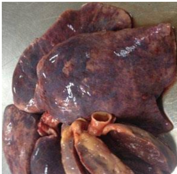
Fig. 1 - Vista macroscópica del corazón, hígado y pulmones, afectados por la sepsis. Se observan infartos y abscesos.