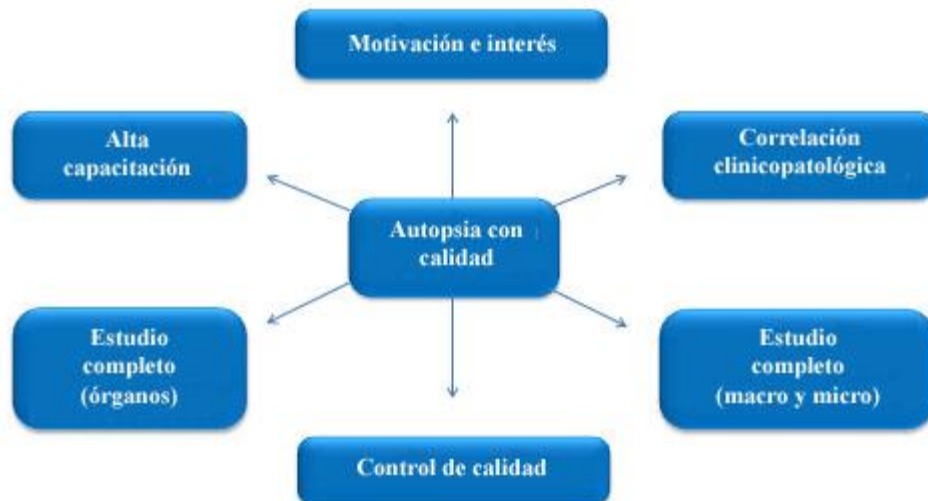
Fig. 2 - Requisitos para una autopsia con elevada calidad.

Una autopsia realizada con elevada calidad, permite precisar las causas de muerte. Para lograrlo, además de profundizar en la relación clinicopatológica, es necesario estudiar la muerte como un proceso sistémico, y al esquematizarlo señalar la enfermedad que le dio inicio, la CBM, hasta la enfermedad que finalmente produjo la muerte, CDM, y las CIM y CC cuando las hubiera. Además, al precisar los otros diagnósticos suman en total, generalmente, entre 15 y 20 diagnósticos.