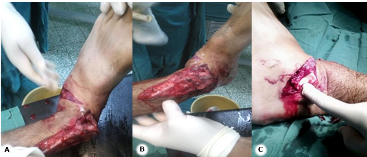
Fig. 1 - Exposición del tobillo izquierdo. A y B: deformidad en varo y heridas avulsivas. B: herida que muestra la protrusión del astrágalo.

Se clasifica la lesión en el grado III-B de Gustillo y Anderson. Hay destrucción del complejo ligamentoso y cápsula articular. A la palpación presenta crepitación ósea, movilidad anormal del externo distal de la tibia y dolor intenso. No presentó lesión neurovascular.