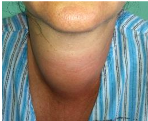
Fig. 1 - Paciente con absceso tiroideo.

La paciente continuó evolucionando satisfactoriamente; fue dada de alta hospitalaria al duodécimo día del ingreso, con seguimiento por consulta externa. Cuatro años y 10 meses después, la paciente se mantiene libre de síntomas.