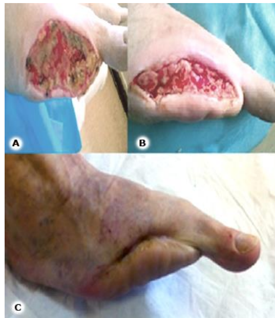
Fig. 2 - A: inicio del tratamiento con Heberprot-P después de la revascularización. B: nótese el tejido de granulación. C: lesión cicatrizada.

Se decidió comenzar el tratamiento con Heberprot-P. Se realizaron un total de 19 aplicaciones de manera perilesional e intralesional, 3 veces por semana, con desbridamiento del tejido necrótico y esfacelado cuando fue necesario. Se logró un tejido de granulación útil y una epitelización de la lesión en 49 días (Fig. 2).