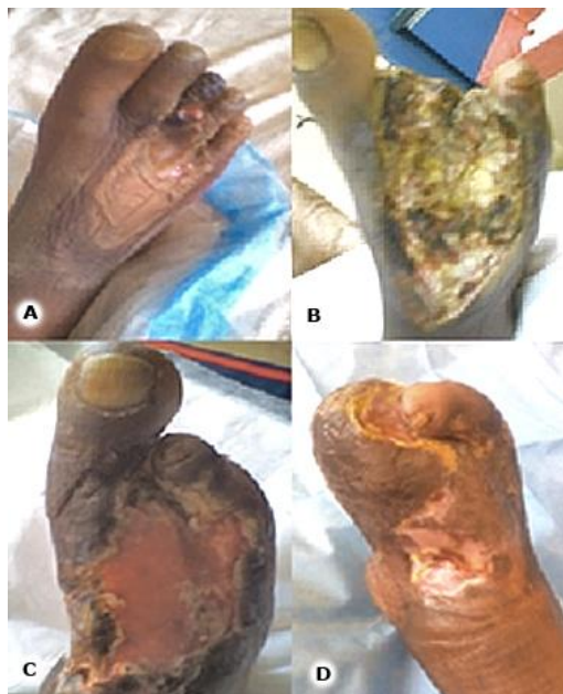
Fig. 3 - A: lesión inicial. B: después de operado y primer día del tratamiento con Heberprot-P. C: nótese el tejido de granulación y la epitelización hacia los bordes. D: lesión cicatrizada.

Al ingresar se realizaron exámenes complementarios con los siguientes resultados: proteína C reactiva, 249,4 mg/L, índice neutrófilos/ linfocitos, 5,1, leucograma en 18,1 \times 10^9 g/L y hemoglobina glucosilada en 14,9 %; evidencias del descontrol metabólico desde meses anteriores. Se decidió comenzar el tratamiento con Heberprot-P. Se realizaron 22 aplicaciones y en cada sesión se realizó la resección de tejidos necróticos y esfacelados. En el transcurso del tratamiento fue necesaria la desarticulación del 1er dedo, el cual, después de un trauma, evolucionó hacia la necrosis. En ese periodo fue necesario detener el tratamiento con Heberprot-P, por una infección sobreañadida. Se logró la granulación total de la lesión en 73 días y quedó una superficie limpia, para colocar un injerto de piel (Fig. 3).