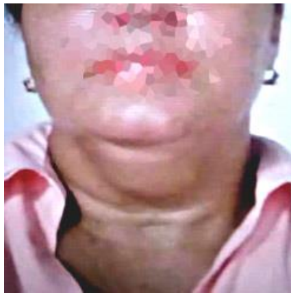
Fig. 1 - Tumoración cervical anterosuperior y cicatriz en corbata de Kocher.

Al examen físico cervical con las maniobras de Lahey, Crille y Quervain, no se detectaron nódulos en el lóbulo izquierdo de la glándula tiroidea; tampoco presencia de adenomegalias. Sin embargo, se evidenció una tumoración de casi 8 cm, visible y palpable, en la región anterosuperior del cuello, redondeada, que se movilizaba con la maniobra de Hamilton Bayle, pero no con la deglución; bien delimitada, indolora, de consistencia firme, irreductible, no pulsátil, sin alteración de la piel que la recubre ni signos flogísticos (Fig. 1).