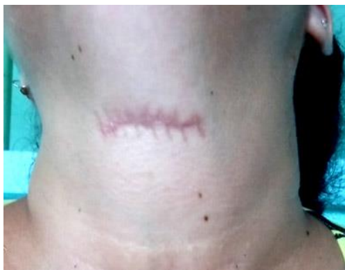
Fig. 2 - Cicatrices cervicales: actual y antigua.

Se realizó consulta de seguimiento al mes; se encontró en buen estado de salud (Fig. 2) y se le informó el resultado de la biopsia posoperatoria (B-23-688): tejido tiroideo que se corresponde con tiroiditis de Hashimoto (Fig. 3). Se le explicó a la paciente la discordancia clínica-imagenológica-citológica-histológica, al tratarse de tejido tiroideo ectópico en el conducto tirogloso, asociado a inflamación crónica específica (TH) y con tiroides ortotópico normofuncionante además.