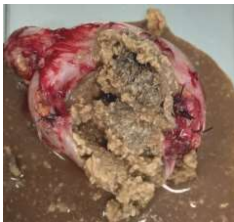
Fig. 2 - Quiste derecho con contenido sebáceo y pelos en su interior.

En el estudio se reveló desde el punto de vista macroscópico, pieza derecha quística de 9 x 7 x 4 cm, superficie lobulada, serosa de color castaño claro y pieza izquierda quística de 6 x 5 x 3 cm. Al corte se observa contenido sebáceo y pelos en su interior (Fig. 2).