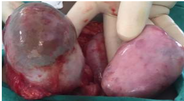
Fig. 1 - Quiste de ovario bilateral.

Se realizó laparotomía exploradora. Durante el procedimiento se constató quiste de ovario derecho, de 9 cm y quiste de ovario izquierdo de 6 cm (Fig. 1); útero de características normales. Se realizó quistectomía bilateral. La paciente tuvo una evolución favorable y fue egresada. Se le realizaron ecografías evolutivas sin recidiva.