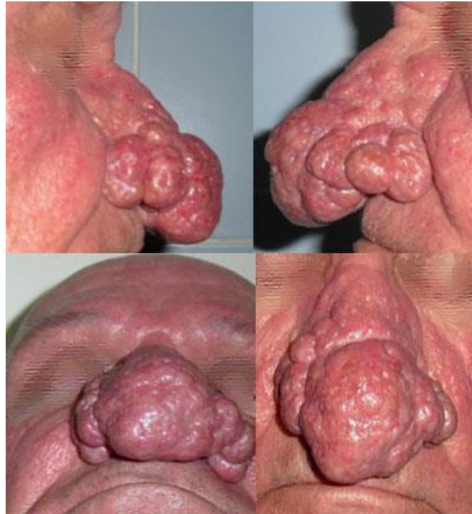
Fig. 3 - Tipo 3. Fusión de las subunidades anatómica nasales, sobre todo las alas y la punta, ángulo nasolabial cerrado y ausencia clínica de los orificios nasales.