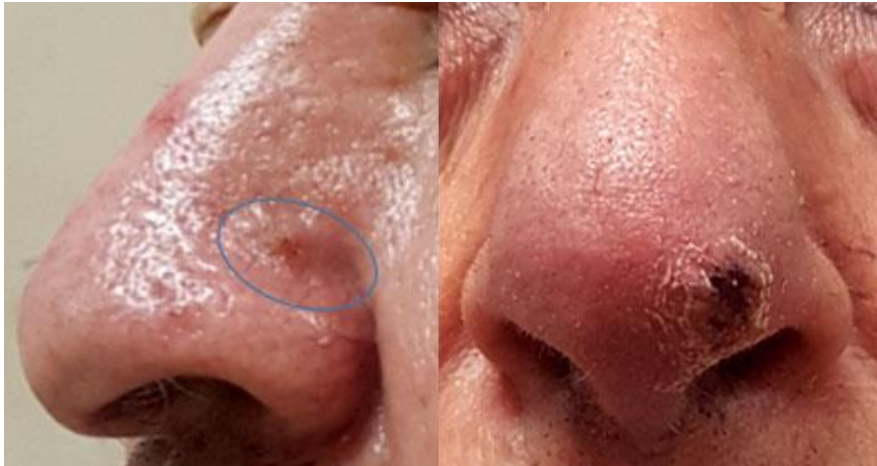
Fig. 4 - Tipo 4. Lesión de aspecto clínico maligno.

El instrumento evaluador de clasificaciones clínicas de Rodríguez y otros (8) consta de 5 ítems en el cual se evalúa la objetividad, es decir: