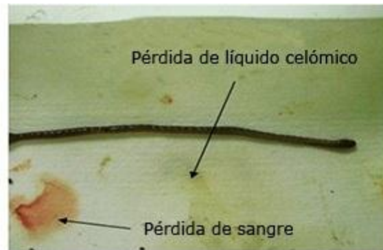
Fig. 1. Organismo expuesto a nanopartículas de Ag < 3 nm.

En cuanto a las alteraciones fisiológicas y conductuales comenzaron a aparecer durante las primeras 24 horas, asociadas con las muertes observadas a las 48 horas en algunos casos. Los mayores porcentajes de alteraciones fisiológicas y conductuales fueron observados en el grupo expuestos a NPs de Ag < 3 nm, donde el 30 % de los organismos presentaron algún tipo de daño, siendo más significativos las alteraciones en la conducta y la pérdida de fluido celómico y sangre, aspecto que se muestra en la figura 1 . En el resto de los grupos la frecuencia de efectos fue menor.