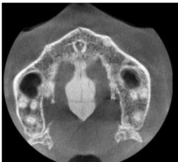
Fig. 1 - Vista axial de la tomografía computarizada de haz cónico, se observa imagen hiperdensa compatible con torus palatino.