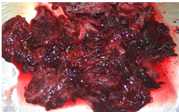
Fig. 3 – Muestra necrótica macroscópica de tejido pulmonar.

En la necropsia se pudo constatar en los estudios macro y microscópicos, una necrosis pulmonar masiva debido a una aspergilosis angioinvasiva (Fig. 3).