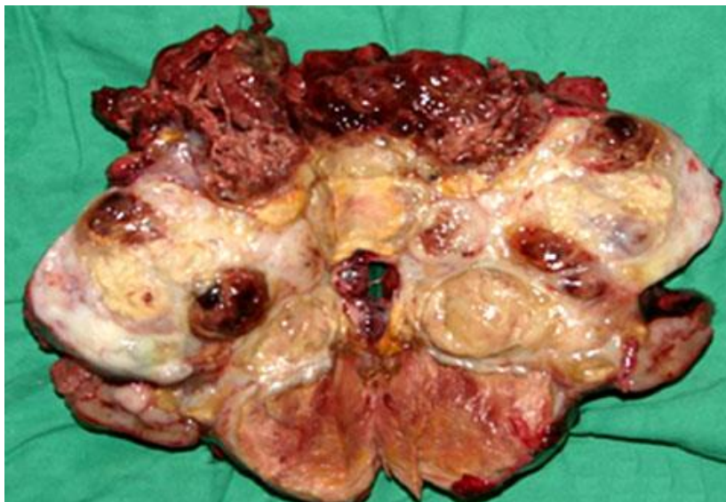
Fig. 1 – Vista posterior del tumor mediastinal resecado.

A los 2 meses del alta, regresa al hospital por síntomas de dificultad ventilatoria, desde aproximadamente 7 días de evolución, además de ingurgitación yugular bilateral y edema en esclavina. Se diagnosticó un síndrome mediastinal, con bloqueo, tanto vascular como respiratorio. En las imágenes radiológicas se pudo constatar una radiopacidad total del hemitórax derecho.